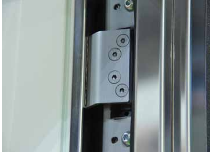
Particolare della cerniera a scomparsa.